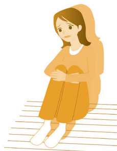
この世から消えて しまいたい気持ちになる

ビムパット服用中に、体調の変化を感じた場合は、主治医や薬剤師に相談するようにしてください。