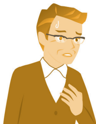
不整脈などの 脈拍や心臓の異常